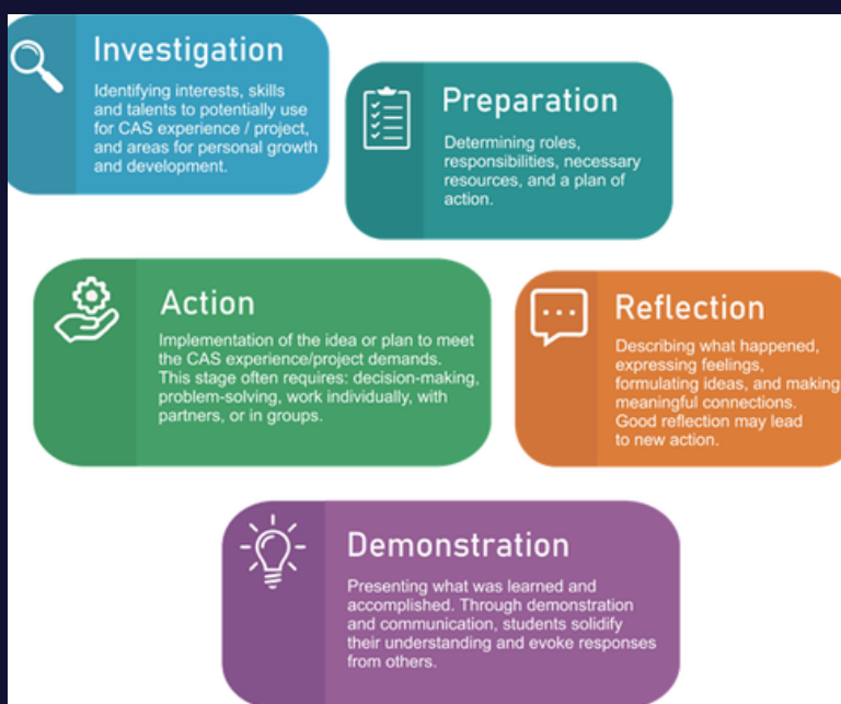
CAS-тың бес кезеңі